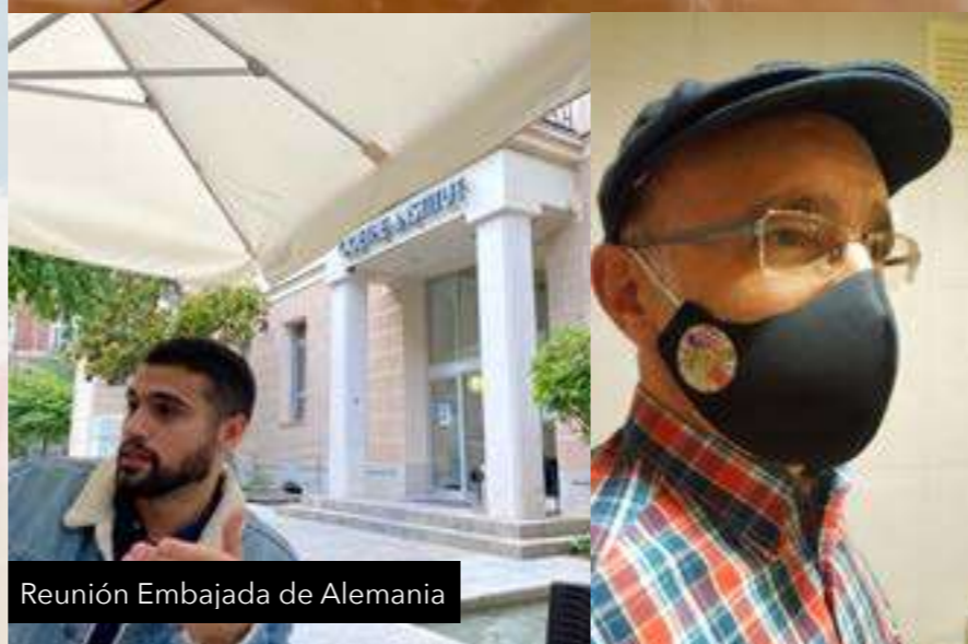
Reunión Embajada de Alemania