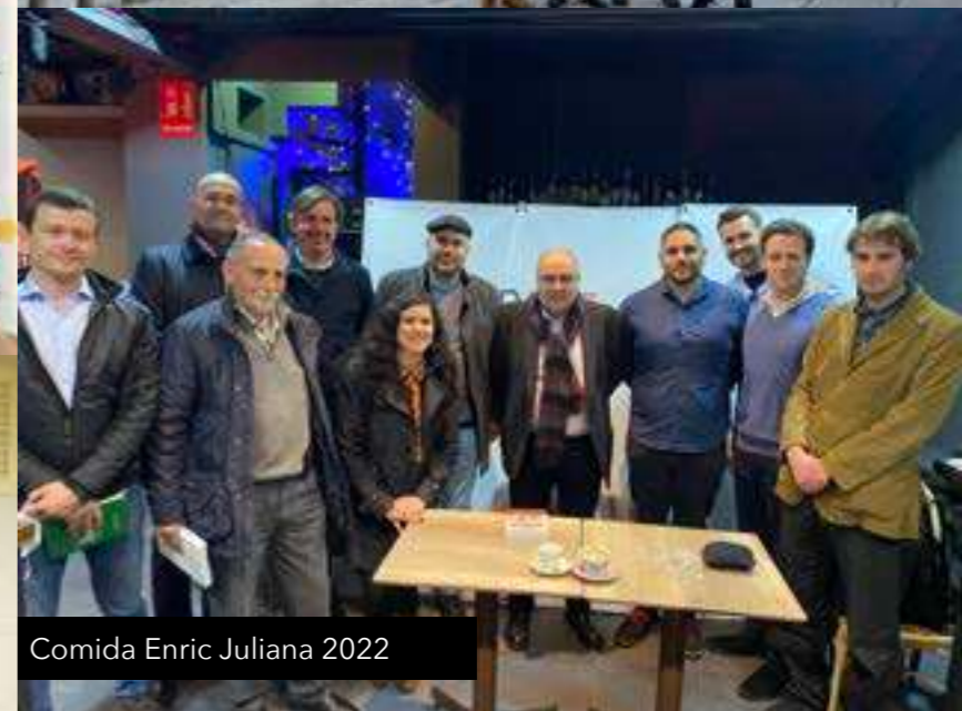
Comida Enric Juliana 2022