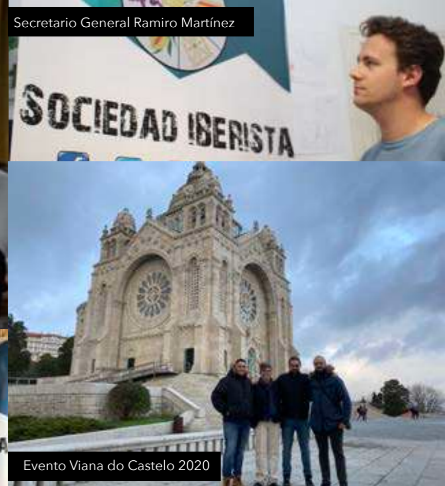
Evento Viana do Castelo 2020