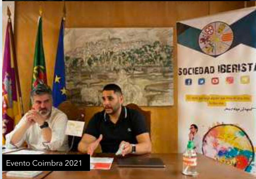
Evento Coimbra 2021