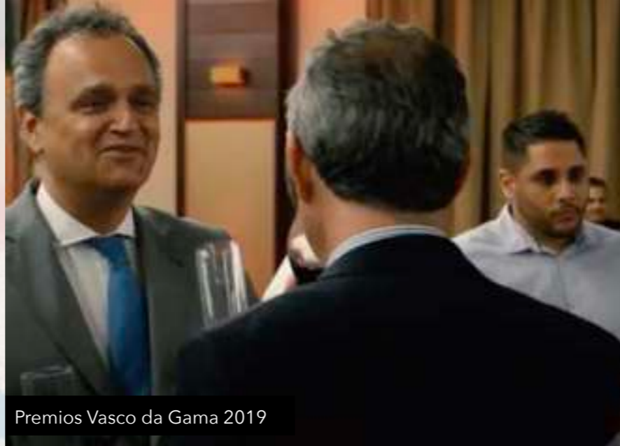
Premios Vasco da Gama 2019